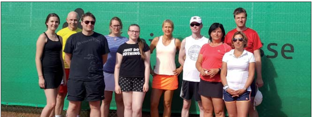
Die Teilnehmer am letztjährigen Neumitgliedertraining

Für die Einteilung der Gruppen treffen wir uns am Sonntag, 28. April um 16.00 Uhr (Anmeldung auch noch vor Ort möglich) auf der Terrasse vor dem Vereinsheim. Wenn vorhanden bitte Tennisschuhe mitbringen, da ein kleines „Testspielen“ stattfindet, damit die Gruppen passend zur Spielstärke eingeteilt werden können. Trainingsbeginn ist dann in der Woche ab 29. April. Für alle Anwesenden gibt es ein Glas Sekt zur Begrüßung.