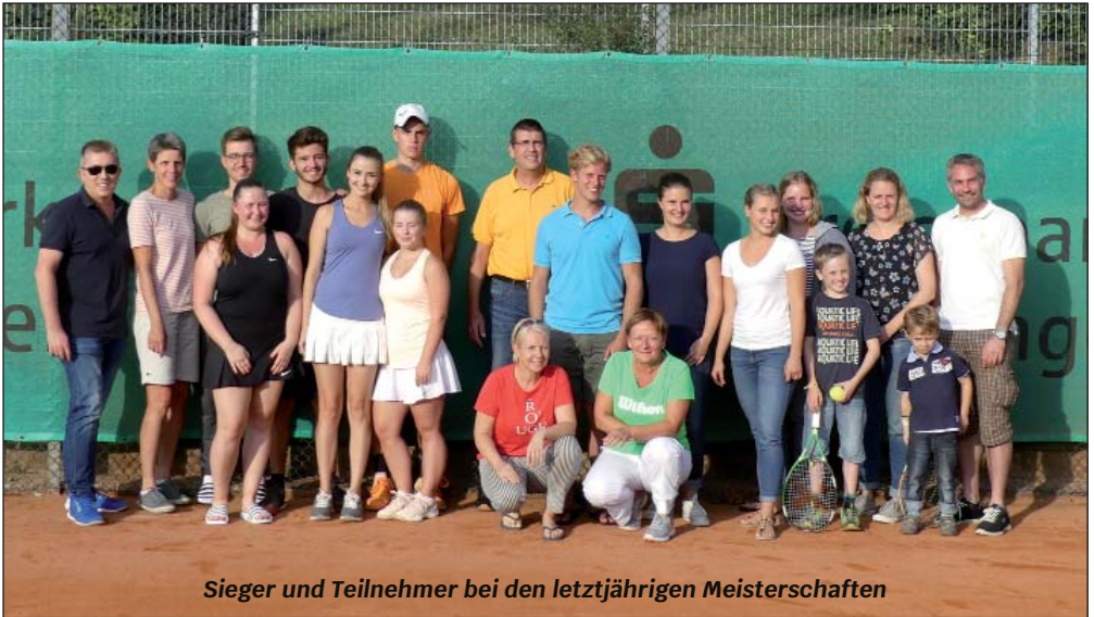
Sieger und Teilnehmer bei den letztjährigen Meisterschaften

Nicht vergessen - unsere beliebten Doppel-/Mixed-Meisterschaften finden vom 20. - 22. September statt.